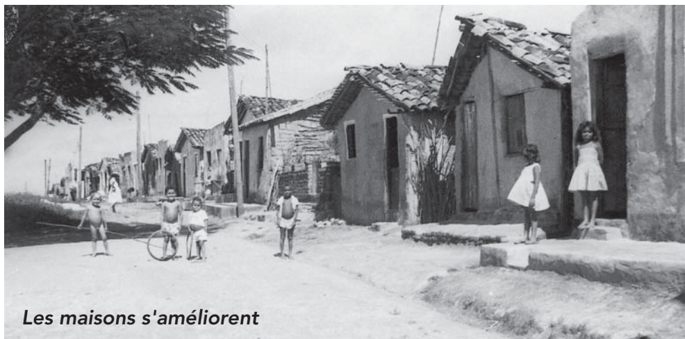
Les maisons s'améliorent