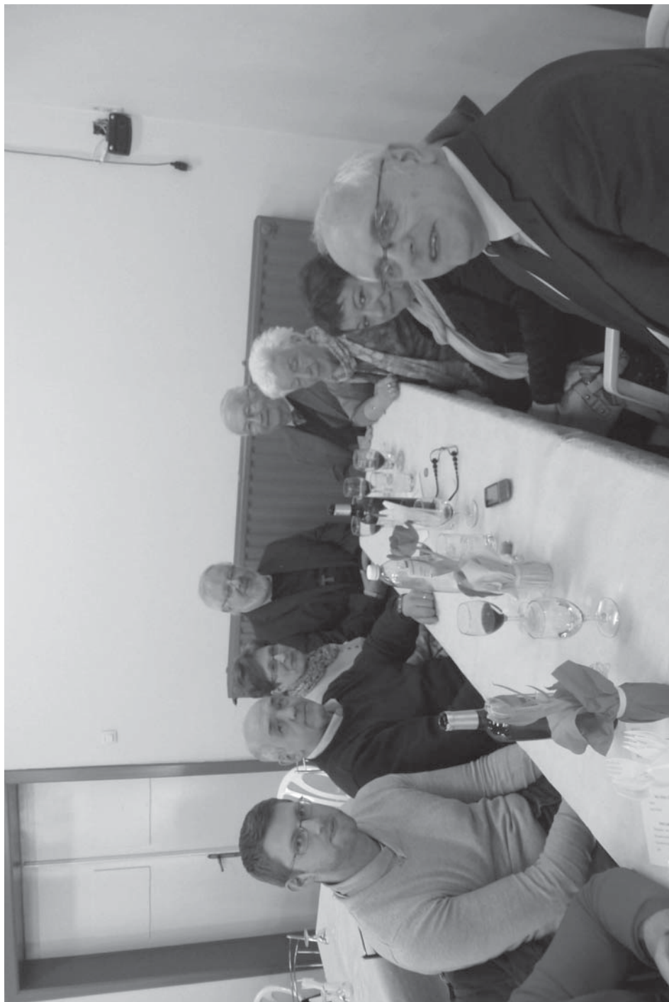
La délégation de Spontin